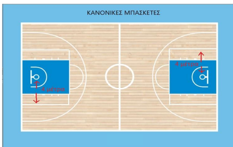
Σχήμα 2: Τετράγωνο τριπόντου

4.3.2 Επίσης, στα κλειστά ή ανοιχτά γυμναστήρια, στα οποία υπάρχει η δυνατότητα, καλό θα ήταν να δημιουργηθεί ένα τετράγωνο (4 μέτρα από το στεφάνι αριστερά - δεξιά σε συνέχεια με τη γραμμή της ελεύθερης βολής) όπου τα εύστοχα σουτ που πραγματοποιούνται έξω από αυτό, θα μετράνε τρεις (3) πόντους (βλ. σχήμα 2). Εάν δεν υπάρχει δυνατότητα δημιουργίας τετραγώνου του τριπόντου, τότε οποιοδήποτε σουτ έξω από τη ρακέτα, μετράει για τρεις (3) πόντους.