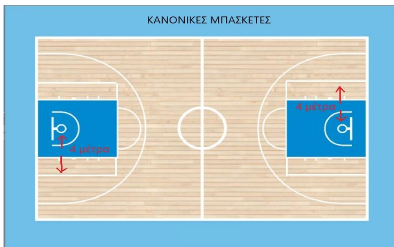
Σχήμα 2: Τετράγωνο τριπόντου

4.3.2 Επίσης, στα κλειστά ή ανοιχτά γυμναστήρια, στα οποία υπάρχει η δυνατότητα, καλό θα ήταν να δημιουργηθεί ένα τετράγωνο (4 μέτρα από το στεφάνι αριστερά - δεξιά σε συνέχεια με τη γραμμή της ελεύθερης βολής) όπου τα εύστοχα σουτ που πραγματοποιούνται έξω από αυτό, θα μετράνε τρεις (3) πόντους (βλ. σχήμα 2). Εάν δεν υπάρχει δυνατότητα δημιουργίας τετραγώνου του τριπόντου, τότε οποιοδήποτε σουτ έξω από τη ρακέτα, μετράει για τρεις (3) πόντους.